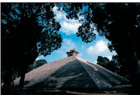
Mausolée de Shao Hao

Le nouveau schéma directeur de 2003 concerne une superficie de 895,93 km 2 . Le plan circonscrit des espaces de préservation majeurs, formulés de la manière suivante : "deux villes, deux surfaces, trois axes, quatre montagnes". Les deux villes sont celles de Lu et des Ming, les deux surfaces : la nécropole Konglin et le Tombeau de Shaohao, les trois axes : ceux du Temple Kongmiao, du Temple de Zhougong et de la Tombe de Shaohao ; les quatre montagnes font référence aux monts Nishan, Jiulongshan, Shimenshan et Jiuxianshan.