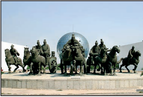
Cité des six arts

ont décidé de déplacer le centre politique et administratif du district de Ji'ning à Qufu. Le plan de cette nouvelle ville fut réalisé par le bureau de planification de la province du Shandong et l'Institut de design du Shandong. Une volonté de ce schéma directeur était d'intégrer la ville dans un vaste jardin, intégrant histoire, tradition et modernité.