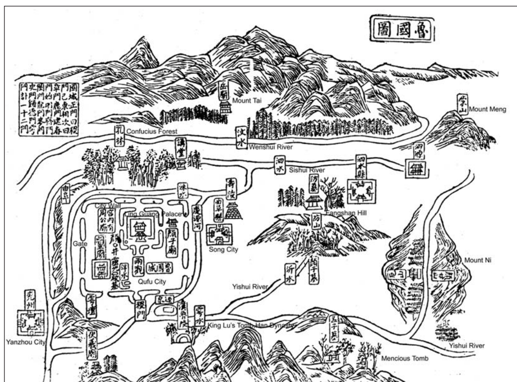
Carte de la Dynastie Jin

Situé au centre de la province du Shandong, son sommet, le pic Yuhuang, se dresse au nord de la ville de Tai'an, avec une altitude de 1545 mètres. Le mont Taishan est l'un des berceaux de la civilisation chinoise. En effet, les régions autour du mont faisaient partie des centres politiques, éco-