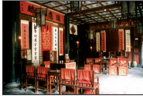
Une des salles de l'ancienne Résidence de la famille de Confucius

Le plan stratégique de la Cité Ming sera approuvé en 2007. Il a été élaboré dans le cadre de la mission confiée à l'Université Tongji pour établir le Plan de protection et de mise en valeur du centre historique de Qufu, dans le cadre de la