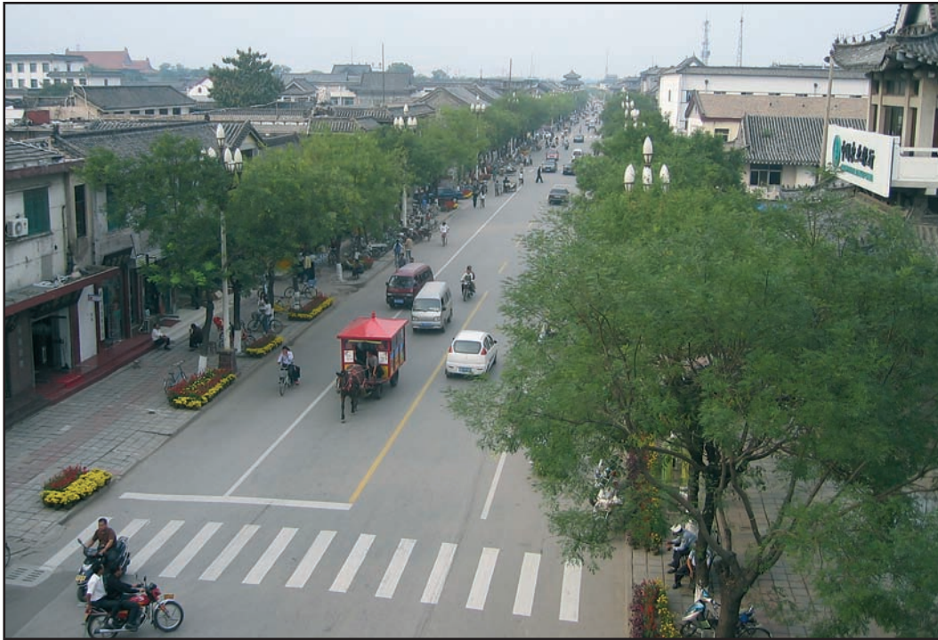
Percée nord-sud de la rue Gu Lu

détruits : arches urbaines, temples secondaires, résidences des branches latérales... et de grands équipements ont été construits : écoles, casernes, hôpitaux... Les fortifications furent détruites en 1978 et ont fait l'objet d'une reconstitution en 2003. Seuls quelques fragments originaux subsistent dans les angles nord, et les portes Nord et Sud. L'aménagement des abords (douves, promenades) est engagé depuis 2004.