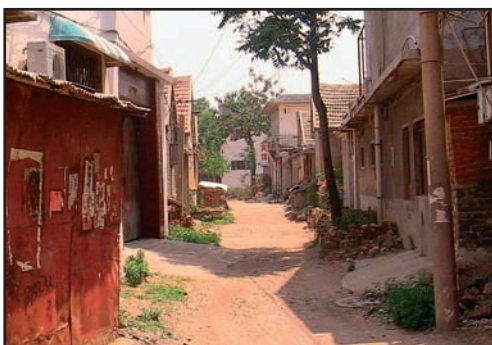
Ruelle de la Cité Ming

La Cité Ming s'est peu à peu densifiée et abrite aujourd'hui quelque 10 000 habitants. Les conditions précaires de confort et de salubrité font qu'une partie de la population migre vers la ville nouvelle durant la période hivernale.