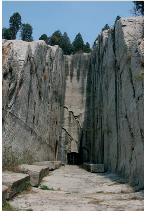
Montagne des Neufs Dragons