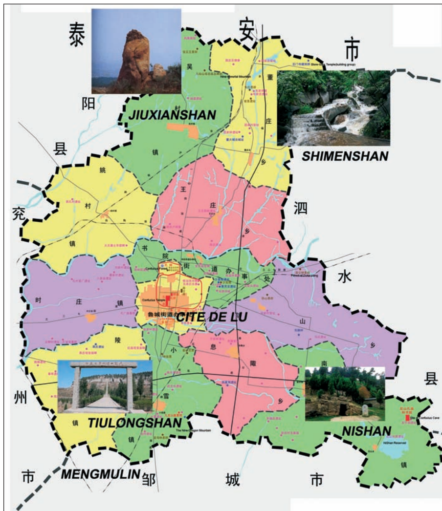
Plan des subdivisions de la municipalité de Qufu (896 km²)

Protection et mise en valeur du patrimoine urbain de la Cité Ming