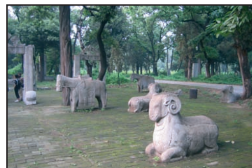
Forêt de Confucius

Il y a une longue histoire de la sculpture des pierres à Qufu. On trouve aujourd'hui, dans le Temple de