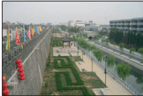
Remparts et douves

Pour protéger les patrimoines nous suivons toujours les lois et les règlements, respectons les conventions internationales. Nous nous sommes donnés cette conscience : "La sécurité des patrimoines historiques, c'est la garantie de toute la ville" et notre travail sur les patrimoines est exemplaire dans tout le pays.