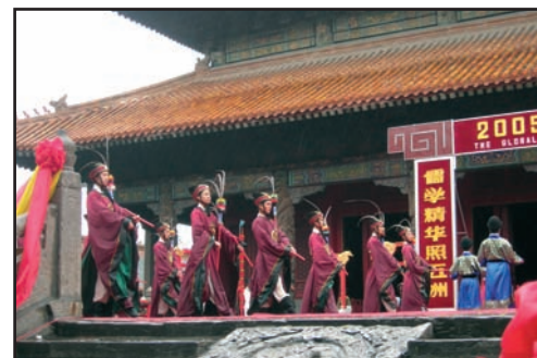
Festival de Confucius - Danse devant la Salle de la Grande Perfection

On attachait beaucoup d'importance aux activités de commémoration dans la société antique. Elles ont pour l'origine les cérémonies de commémoration que des disciples de Confucius organisaient devant son Temple. Les danses et musiques de cérémonie n'ont pas beaucoup varié pendant deux mille ans, depuis les premières cérémonies jusqu'à la Dynastie des Qing : les mélodies, rythmes, l'intensité de son, comme les instruments n'ont pas tellement changé.