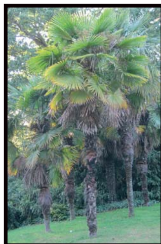
Palmier de Chine (7)