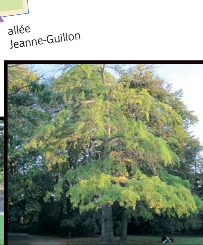
Ginkgo Biloba femelle (17)